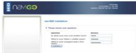
Ověřování na základě vědomostí (KBA) poskytuje koncovým uživatelům pohodlí

Nouzový přístup pomocí ověřování na základě vědomostí (KBA) poskytuje rozhodující a pohodlnou pomoc uživatelům, kteří potřebují mít ke svým datům jednoduchý a zabezpečený přístup. Poskytuje rovněž IT administrátorům nástroje, které jsou zapotřebí pro návrh zabezpečených pracovních postupů pro ostatní úkoly správy karet, jako např. vynulování kódu PIN.