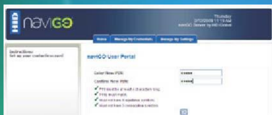
Samoobslužné opětovné nastavení kódu PIN